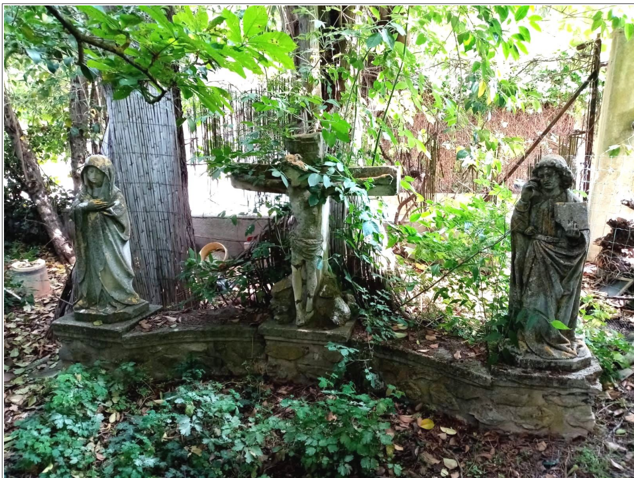
Photographie de la statue au quartier des Trois Bons Dieux, avant son déplacement en 2024 (auteur et date inconnus).

Le groupe sculpté dit « des Trois Bons Dieux » bordait, jusque très récemment, la RD10 (aussi appelée "route de Vauvenargues"). Autrefois placé à l'extrémité nord d'une propriété privée, il est réputé disparu depuis 2024.