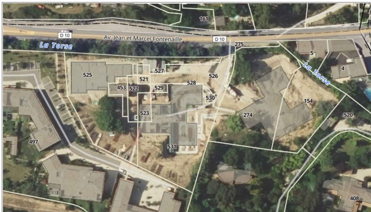
Plan de situation permettant de visualiser l'organisation des bâtiments actuels du « Domaine Saint-Marc »..

La parcelle où il était localisé jusqu'à cette date, se situant dans le prolongement du parking des Trois Bons Dieux, est aujourd'hui occupée par trois bâtiments appartenant à une résidence privée, le « Domaine Saint-Marc ». Elle abritait auparavant une habitation de type bastidaire, entourée de végétation.