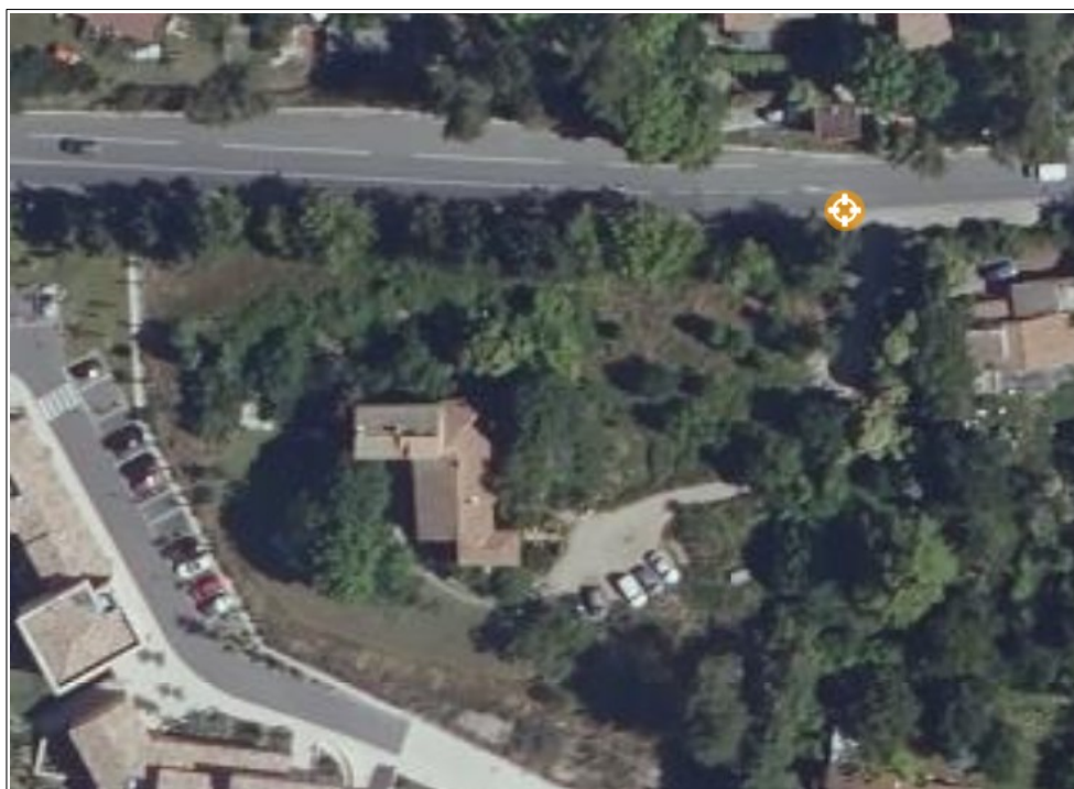
Photographie aérienne de la parcelle de terrain entre 2016 et 2020, avant le chantier immobilier. (Source : https://remonterletemps.ign.fr/ ).